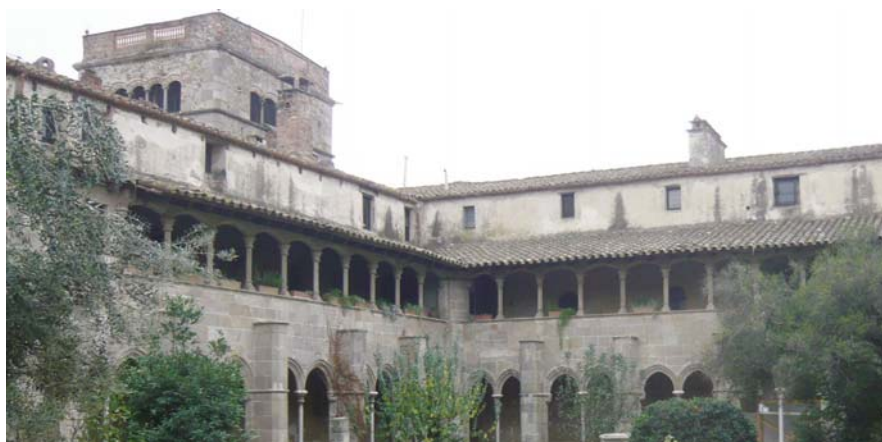
Claustre del Monestir de Sant Jeroni de la Murtra.

Han participat en la votació, que ha estat completament gratuïta i s'ha desenvolupat del 9 al 29 de novembre de 2009, un total de 5.481 persones, que han emès 16.446 vots. Es podia votar per una, dues, tres, quatre, cinc, sis o set de les 40 candidatures que han aspirat a convertir-se en un dels 7 tresors de Badalona. S'han emès vots des de 135 localitats de l'Estat espanyol i, també, des de 41 països diferents.