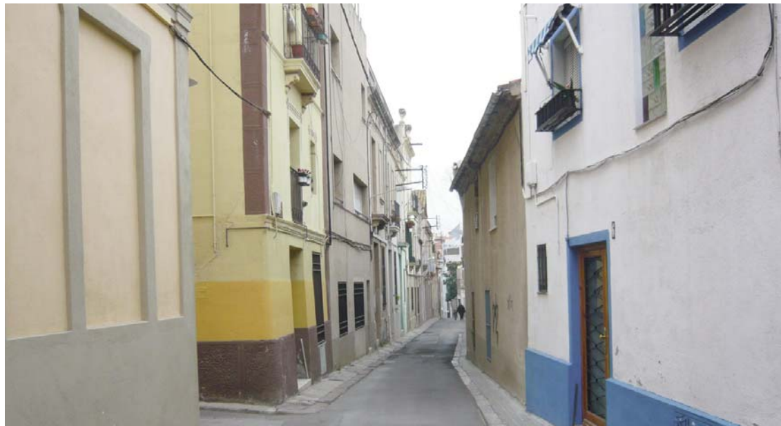
Carrer de Dalt de la Vila.

Dalt de la Vila és el bressol de la ciutat de Badalona i és el barri més antic i estimat pels badalonins. El seu nom té origen en la seva geografia, ja que està situat damunt d'un petit turó proper a la platja. El seu singular traçat urbanístic converteixen el barri en un indret únic. A l'entramat de carrers de Dalt de la Vila, estrets i recargolats com pertoca a una disposició medieval, podem trobar ruïnes romanes, restes arquitectòniques gòtiques, la casa Botey, la Torre Vella, l'església de Santa Maria (edificada sobre un temple romà) i molts racons carregats d'història com el carrer Costa, entre d'altres.