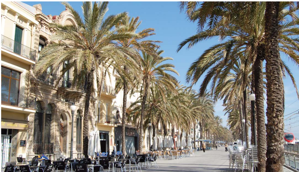
La Rambla de Badalona.

La Rambla és un dels conjunts urbanístics més coherent i atractiu de Badalona. Projectat per Villar Lozano l'any 1878, l'espai, ornat amb palmeres, s'estén paral·lel al litoral de la ciutat on destaquen el conjunt de façanes datades de finals del segle XIX i començament del XX. La Rambla, amb les seves terrasses, bars, restaurants i la seva proximitat a la platja, ha estat molt arrelada a la vida badalonina i s'associa a diversos moments festius i tradicionals de Badalona, com ara la Cremada del Dimoni, que se celebra a les Festes de Maig.