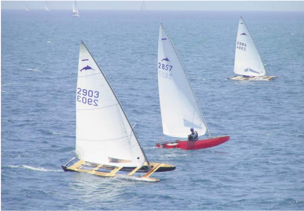
El patí de vela és autòcton de Badalona.

El 27 de maig de 2008, l'Ajuntament de Badalona va aprovar una moció per declarar al Patí de Vela, embarcació genuïna de Badalona, i incorporar-lo al catàleg de patrimoni cultural de la ciutat.