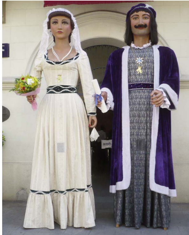
La Maria i l'Anastasi.

L'Anastasi i la Maria són els gegants més emblemàtics de la ciutat i, a més, uns dels més antics de Catalunya. Aquests gegants duen els noms dels patrons de la ciutat i foren construïts el 1858 gràcies a diverses rifes i subscripcions organitzades per la Confraria de Sant Anastasi. Com va passar en d'altres poblacions catalanes, cap als anys 20, i per motius que es desconeixen, van canviar el seu aspecte per lluir indumentària reial. El seu protocol marca que han de sortir activament durant les Festes de Maig i la Festa Major d'Agost (on entren a l'església de Santa Maria i interpreten, durant les ofrenes, el seu ball protocolari). També surten, puntualment, a pobles on se'ls requereix pel seu valor històric.