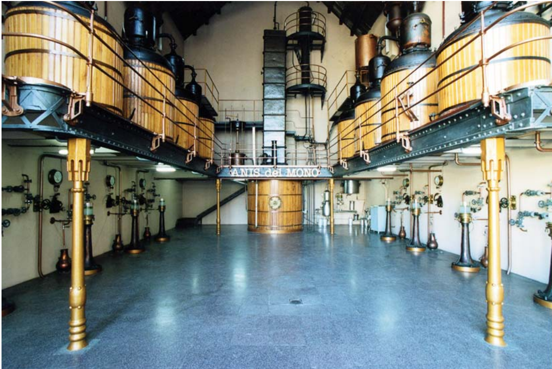
Vista general de la destil·leria Anís del Mono.

En aquesta segona fase constructiva d'estil modernista i de gran valor patrimonial trobem l'edifici destinat a l'administració, arxiu i oficines, i el destinat a la producció, que encara avui conserva la maquinària original. En el primer es poden admirar, a més a més del molt ben conservat mobiliari de fusta i vidre, diversos cartells de caire modernista com els de Ramon Casas.