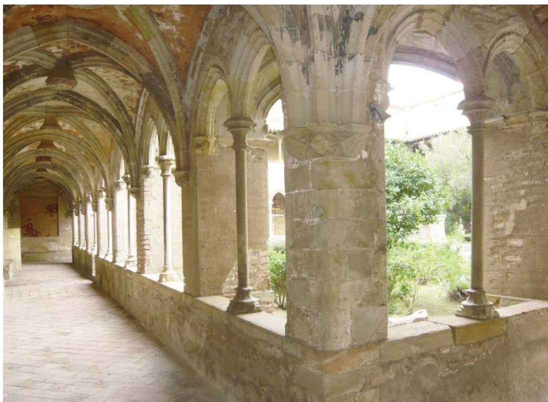
Claustre de Sant Jeroni de la Murtra.

El Monestir va arribar al seu màxim esplendor sota el regnat dels reis catòlics, els quals van realitzar grans obres a l'edifici i van celebrar importants esdeveniments. Cristòfor Colom va ser rebut pels reis i els va comunicar la descoberta del Nou Món. El Monestir està format per un conjunt monumental d'edificis d'estil gòtic tardà dels segles XV i XVI articulats entorn a l'església, de la que actualment només es conserva l'absis i capelles laterals, i el claustre, declarat l'any 1975 Monument Històric Artístic d'Interès Nacional, que consta de tres galeries de dos pisos d'arcs apuntats i cobertes amb voltes nervades decorades amb retrats i escuts d'armes dels seus benefactors o relacionats amb el monestir, com els reis Ferran, Isabel, Carles I, Cristòfol Colom o Ramon Llull.