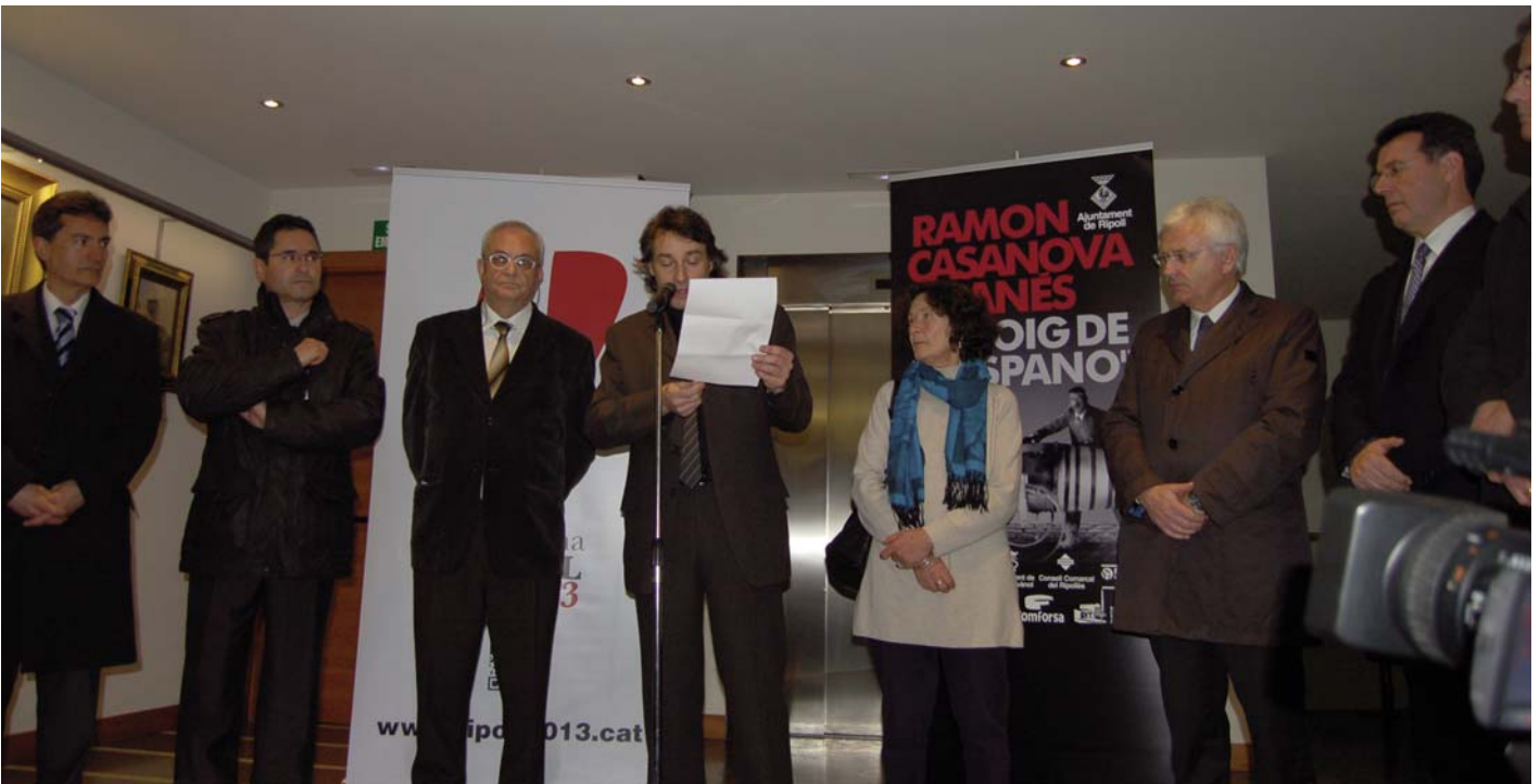
Acte d'inauguració de l'exposició "Ramon Casanova i Danés. El boig de l'Hispano"