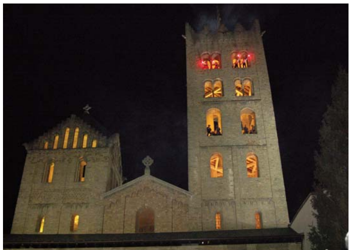
El Monestir de Santa Maria de Ripoll va ser l'escenari de "Pel corrent dels temps" l'espectacle inaugural de la Capital de la Cultura Catalana Ripoll 2013

El programa d'actes de la Capital de la Cultura Catalana Ripoll 2013 es pot descarregar des del web www.ripoll2013.cat