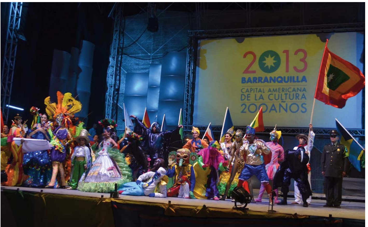
La Reina del Carnaval llegeix el pregó del Carnaval en el marc de la inauguració de la Capital Americana de la Cultura 2013

Finalment, la Ministra de Cultura de Colòmbia, Mariana Garcés Córdoba, va expressar "tot el suport del govern nacional a la Capital Americana de la Cultura Barranquilla 2013".