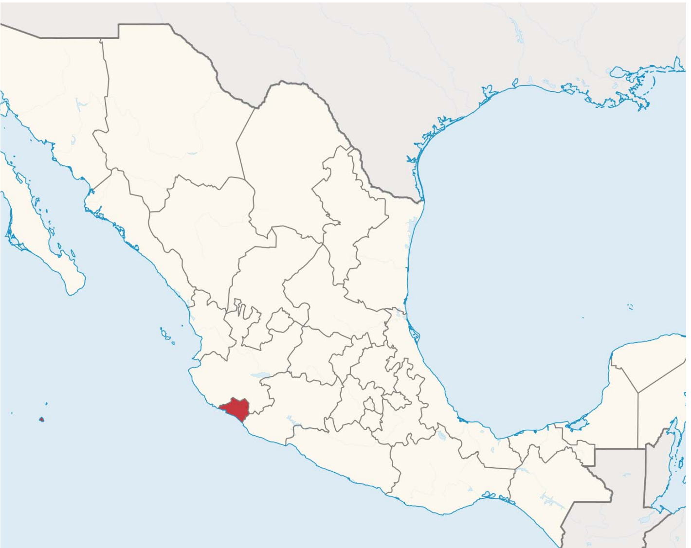
Localització de l'Estat mexicà de Colima, Capital Americana de la Cultura 2014

Una vegada es coneguin els 7 tresors del patrimoni cultural de l'Estat de Colima, els elements elegits s'incorporaran a la Llista representativa del patrimoni cultural del món del Bureau Internacional de Capitals Culturals, llista en la qual hi ha, entre molts d'altres, els tresors de Catalunya, de Barcelona i de Badalona, els d'Asunción (Paraguai), Brasília (Brasil), Madrid (Espanya), Nizhny Novgorod (Rússia), Quito (Equador), Santo Domingo (República Dominicana), São Luís (Brasil), Sarajevo (Bosnia&Herzegovina), etc.