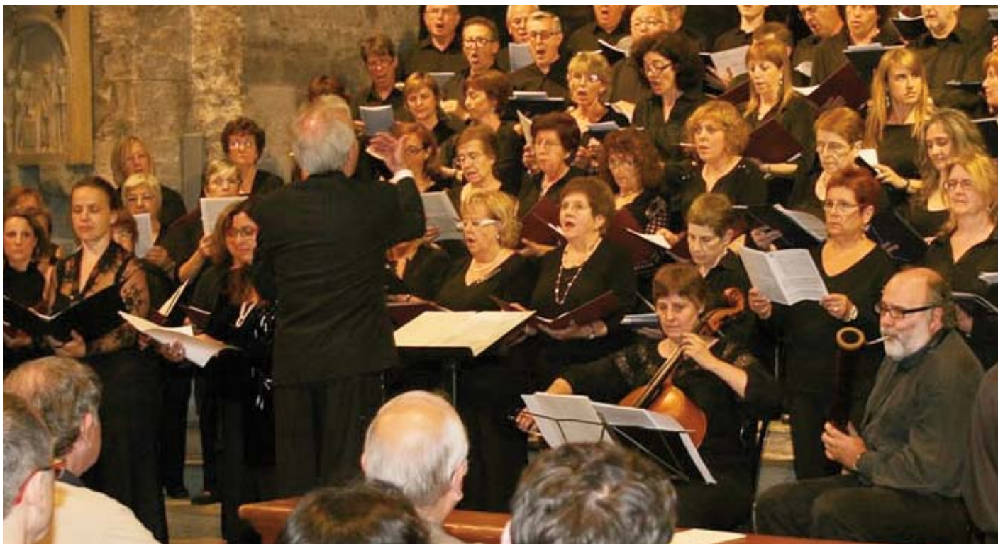
El festival es va iniciar el dia 7 de juliol amb el concert de celebració dels 120 anys de la Capella Santa Maria