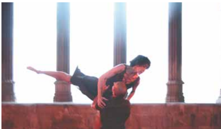
Atemporal. Claustre de la Seu Vella.

El marc incomparable del claustre de la Seu Vella de Lleida va ser l'escenari d'aquesta obra que uneix guerra, música i dansa.