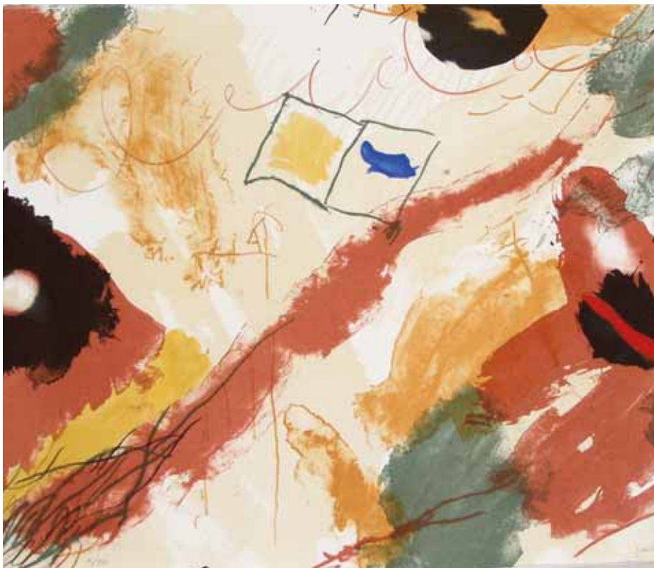
Lleida Capital de la Cultura Catalana 2007. Josep Guinovart.