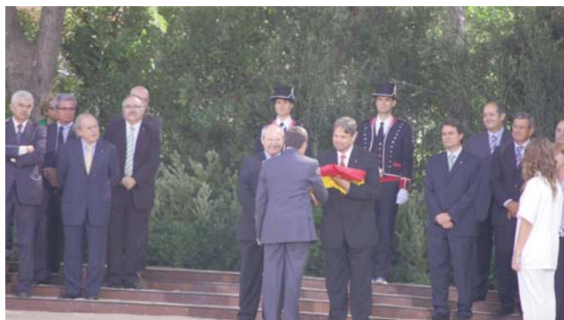
Àngel Ros (d'esquena) lliura la bandera de Catalunya al President del Parlament de Catalunya, Ernest Benach, davant les més altes autoritats del país.