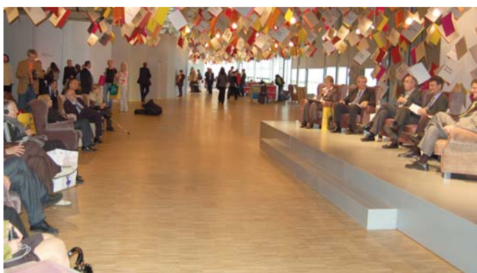
El plató Fòrum de la Fira de Frankfurt en el decurs de l'acte de presentació de les capitals de la cultura catalana i de la candidatura de la ciutat de Tarragona a la Capital Europea de la Cultura l'any 2016.