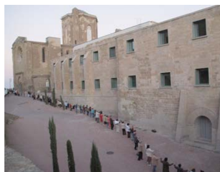
Més de 800 persones van encerclar la Seu Vella i van ballar una sardana.