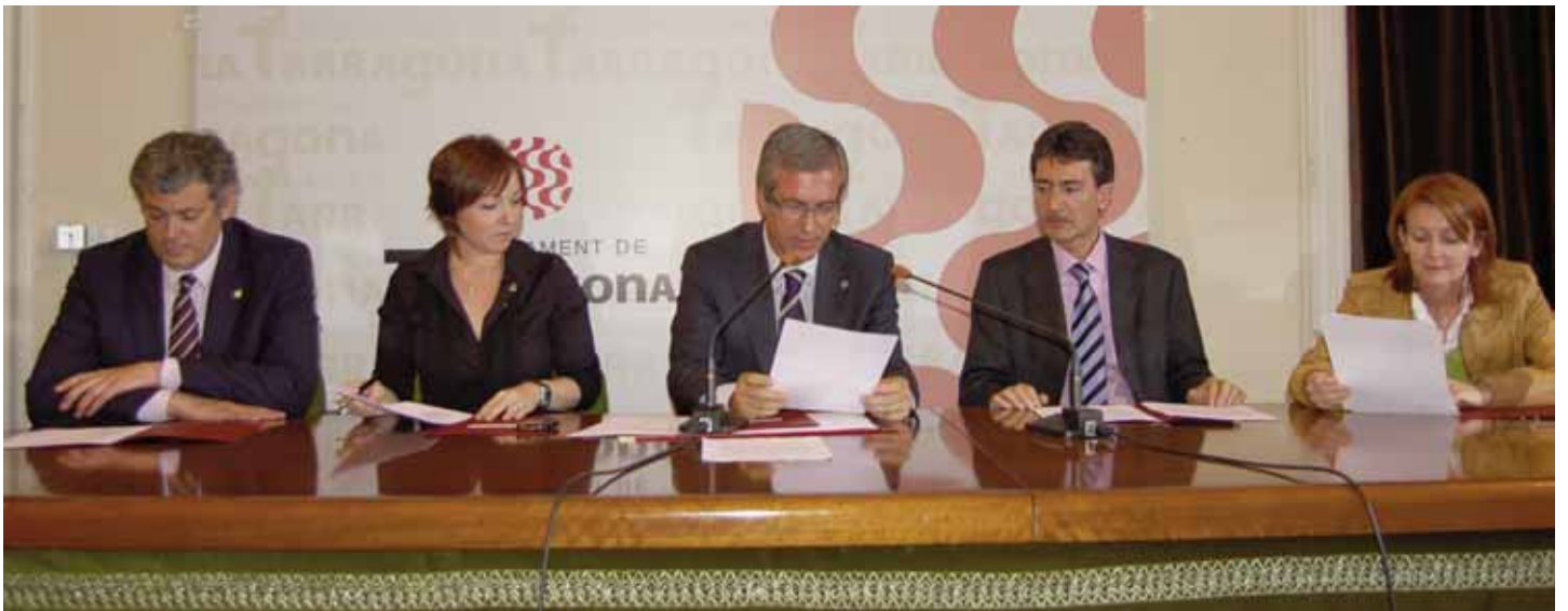
Lectura pública del resultat de l'elecció dels 50 personatges que més han influït en la cultura europea a la sala d'actes de l'Ajuntament de Tarragona.