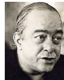
Vinicius de Moraes