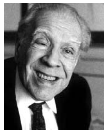
Jorge Luis Borges