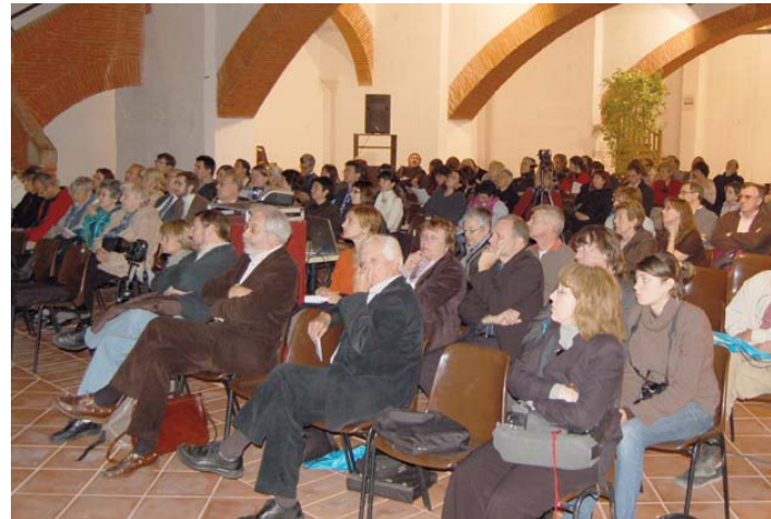
Les sessions es van celebrar al Convent dels Mínims de la Capital de la Cultura Catalana Perpinyà 2008.