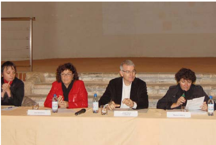
Taula rodona "Com treballar la gestió de patrimoni i turisme cultural".