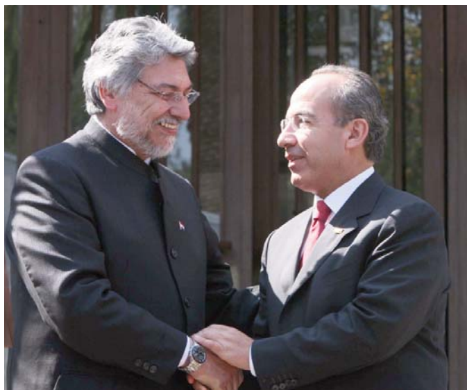
Fernando Lugo i Felipe Calderon a Mèxic.

En un ambient de cordialitat ambdós mandataris van revisar els principals temes de l'agenda bilateral i van reiterar la seva disposició d'aprofundir el diàleg polític, els vincles econòmics-comercials i la cooperació entre Mèxic i Paraguai.