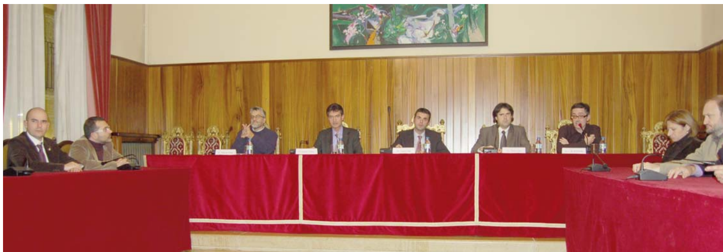
Acte de constitució del Consell Social de la Capital de la Cultura Catalana Figueres 2009.

Dos eixos articularan Figueres 2009: la sardana i el submarí, Pep Ventura i Narcís Monturiol, la cultura popular i tradicional i la ciència i el coneixement. Dos eixos fructífers i frondosos, dos conceptes que, arreals a la tradició i a la història, projectaran el dinamisme i la vitalitat de Figueres al llarg d'un any amarat de participació ciutadana, reflexions, idees, exposicions, concerts i espectacles.