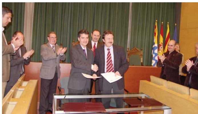
D'esquerra a dreta: Xavier Tudela i Jordi Serra , alcalde de Badalona, després de la signatura de l'acord de nominació de Badalona com a Capital de la Cultura Catalana 2010, a la sala de plens de l'Ajuntament.

El regidor de cultura i patrimoni cultural de Badalona, Jaume Vives , va recordar que l'assoliment de la capitalitat ha estat conseqüència del consens institucional i d'una àmplia implicació ciutadana.