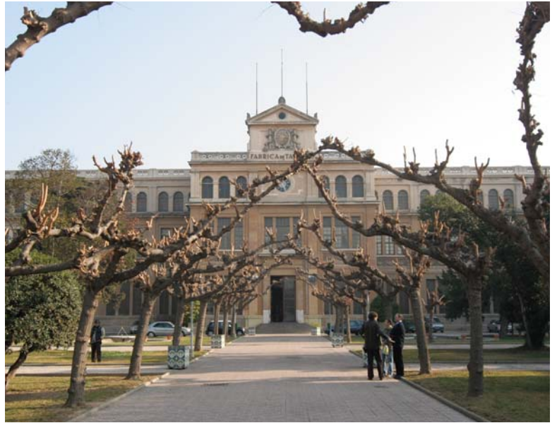
Antic edifici de la Tabacalera.

El Pla d'Equipaments Culturals de Tarragona començarà a ser una realitat a partir de finals de gener, ja que s'acabarà la redacció d'una primera proposta, la qual serà donada a conèixer als sectors culturals de la ciutat perquè hi facin les seves observacions. Dimecres dia 17 de desembre es va signar un conveni de col·laboració entre el Departament de Cultura i Mitjans de Comunicació de la Generalitat i l'Ajuntament de Tarragona per tal de dur a terme aquest projecte. El Pla, una vegada aprovat, servirà per cobrir les deficiències en infraestructures culturals de la ciutat. El Pla d'Equipaments Culturals de Tarragona omplirà de contingut una mancança històrica quant a espais per a les diferents manifestacions de la cultura i representarà la satisfacció d'una reivindicació de molts col·lectius artístics de la ciutat.