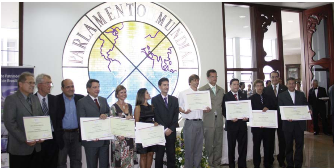
Cerimònia de lliurament dels diplomes acreditatius de les 7 meravelles del patrimoni cultural material de Brasília, celebrada el dia 9 de desembre, a la sala Parlamundo del Temple de Boa Vontade de Brasília.

La campanya de les 7 meravelles de Brasília, impulsada pel Bureau Internacional de Capitals Culturals, amb la col.laboració de Brasiliatur en el cas de Brasília, s'ha emmarcat en l'elecció de les set meravelles del patrimoni cultural material de cinc ciutats del món. A més de Brasília, han participat en l'elecció de les 7 meravelles locals: Barcelona, Madrid, Nizhny Novgorod (Rússia) i Sarajevo (Bòsnia i Herzegovina).