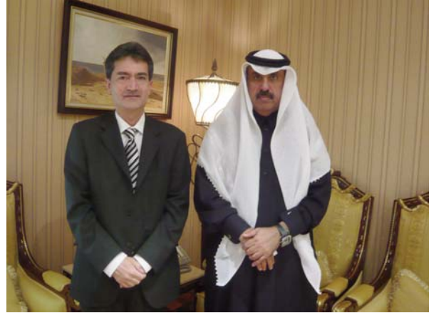
Seu del Ministeri de Cultura de Qatar: Xavier Tudela i Mubarak N. Al-Khalifa, secretari general del Consell Nacional per a la Cultura, les Arts i el Patrimoni de l'Estat de Qatar.

Aquest mateix mes de desembre, Qatar ha inaugurat el Museu d'Art Islàmic, una obra emblemàtica que ha costat 300 milions de dòlars. També actualment s'està remodelant el Museu Nacional i construint nous equipaments culturals. Tot aquest treball es fa amb la voluntat de convertir Doha en referent cultural d'Orient Mitjà i d'arreu del món.