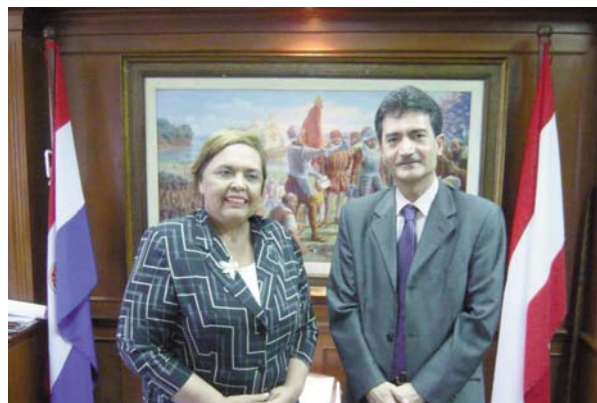
L'alcaldessa d'Asunción, Evangelista Troche de Gallegos, i Xavier Tudela, president del Bureau Internacional de Capitals Culturals.

Asunción té una població de 515.000 habitants, el que representa aproximadament el 10% del total de la població paraguaiana. En la seva àrea metropolitana hi viuen 1.600.000 persones.