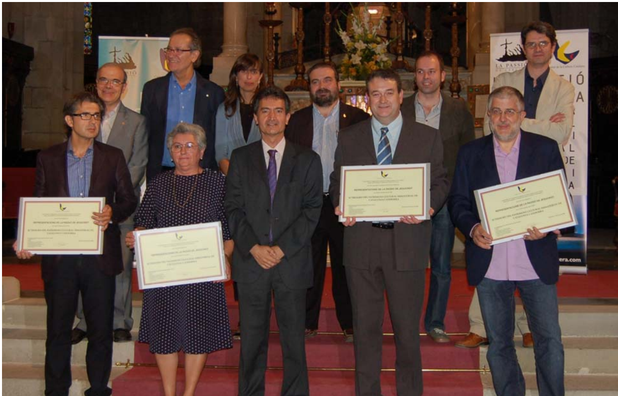
Els representants de les passions de Cervera, Esparreguera, Olesa de Montserrat i Uldecona, juntament amb la representació institucional i el president de l'organització Capital de la Cultura Catalana .