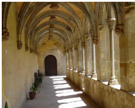
Sant Jeroni de la Murtra