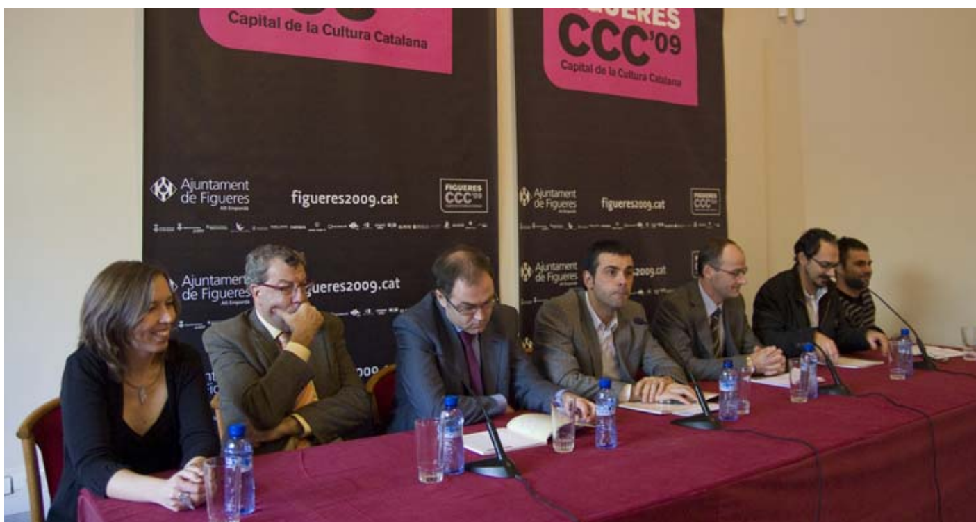
L'alcalde de Figueres, Santi Vila, va presidir l'acte d'inauguració de Giroscopi Cultural.