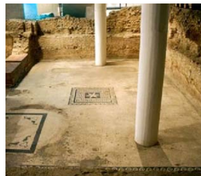
Conjunt Arqueològic Baetulo