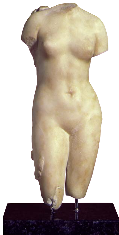
Fons romà de la col.lecció del Museu de Badalona