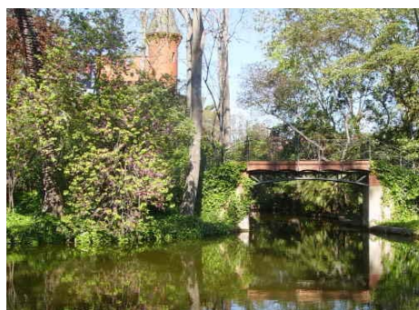
Parc de ca l'Arnús