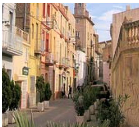
Dalt la Vila