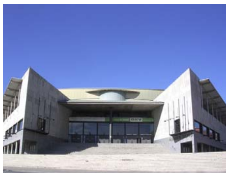
Palau Municipal d'Esports