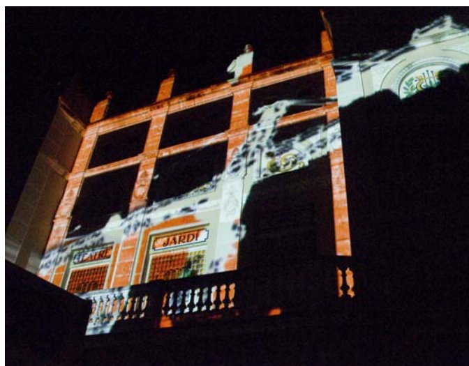
La façana del Teatre Jardí de Figueres va transformar la seva arquitectura davant un nombrós públic en el decurs del Giroscopi Cultural.

Giroscopi Cultural també va oferir altres activitats obertes a tothom com van ser la mostra d'activitats, un espai d'exhibició i d'entreteniment, adreçat tant als professionals del sector com al públic en general, concerts, obres de teatre, presentacions de llibres i tallers i jocs per a tothom.