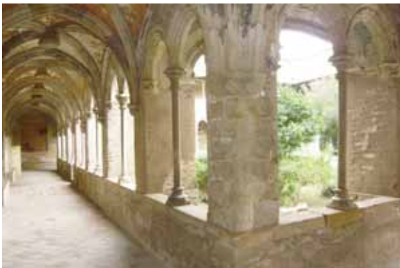
Sant Jeroni de la Murtra

Han participat en la votació, que ha estat completament gratuïta i s'ha desenvolupat del 9 al 29 de novembre d'enguany, un total de 5.481 persones, que han emès 16.446 vots. Es podia votar per una, dues, tres, quatre, cinc, sis o set de les 40 candidatures que han aspirat a convertir-se en un dels 7 tresors de Badalona. S'han emès vots des de 137 municipis, a més de Badalona, de Catalunya i de la resta d'Estat espanyol i, també, des de 41 països diferents.