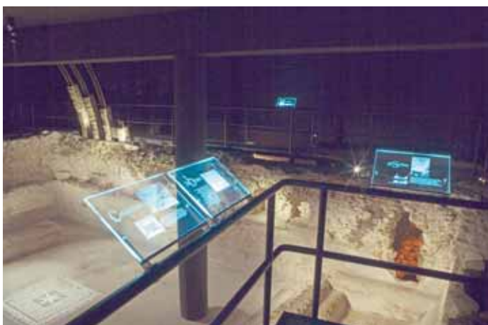
Ciutat romana de Baetulo

Els set tresors de Badalona formaran part a partir d'ara de la llista de tresors del patrimoni cultural material del món del Bureau Internacional de Capitals Culturals que inclou, a més de Badalona, Barcelona, Catalunya, Madrid, Brasília (Brasil), Asunción (Paraguai), Sarajevo (Bosnia i Hercegovina) i Nizhny Novgorod (Rússia).