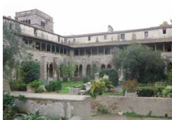
Sant Jeroni de la Murtra

La classificació final de les 40 candidatures, presentades pels ciutadans de Badalona, que han optat a esdevenir un dels set tresors del patrimoni cultural material de la Capital de la Cultura Catalana Badalona 2010 és la següent: