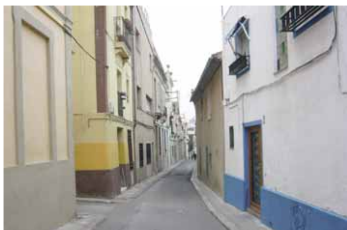
Carrer del conjunt històric de Dalt la Vila