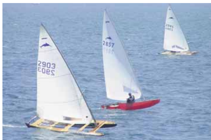
Patí de Vela