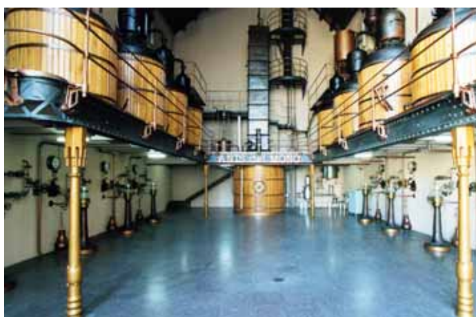
Destil·leria Anís del Mono