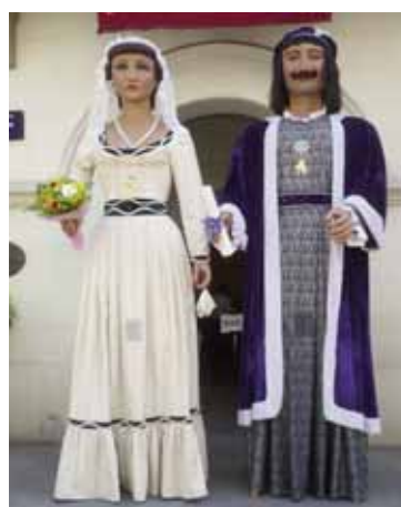
Gegants Anastasi i Maria