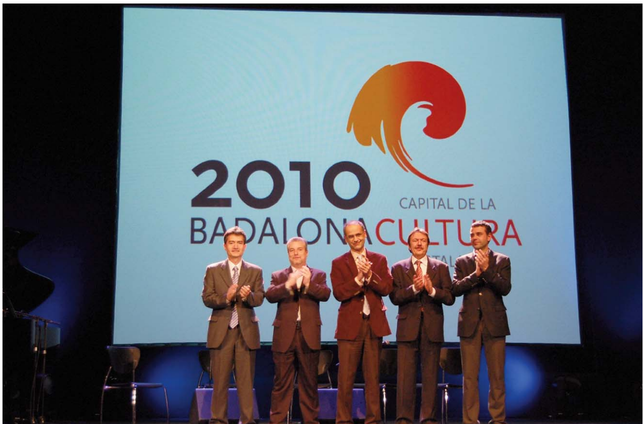
Xavier Tudela, president de l'organització Capital de la Cultura Catalana; Mateu Chalmeta, regidor de Cultura i Patrimoni Cultural de l'ajuntament de Badalona; Antoni Martí, cònsol major (alcalde) d'Escaldes-Engordany; Jordi Serra, alcalde de Badalona, i Santi Vila, alcalde de Figueres, agraeixen al públic la seva presència a l'acte institucional d'inauguració de la Capital de la Cultura Catalana Badalona 2010.

El regidor de Cultura i Patrimoni Cultural de Badalona, Mateu Chalmeta, va recordar que l'ampli procés participatiu en la preparació de la capitalitat assegura la implicació de tothom qui vulgui col·laborar en Badalona 2010.