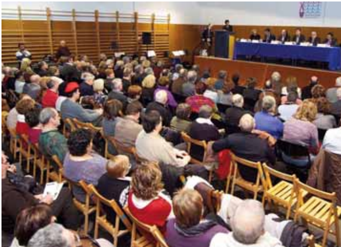
Un nombrós públic va assistir al lliurament a la sardana del diploma que l'acredita com a tresor català i andorrà i a la presentació de la Guia d'Aplecs 2010.

Els 10 tresors del patrimoni cultural immaterial català i andorrà són els següents: Diada de Sant Jordi, Sardana, Castells, Foc de Sant Joan i la Flama del Canigó, representacions de la Passió de Jesucrist, Balls de Diables -diables+correfocs-, Cantada d'havaneres de Calella de Palafrugell, Festa Major de Vilafranca del Penedès, Festa de la Misteriosa Llum de Manresa i la Patum de Berga.