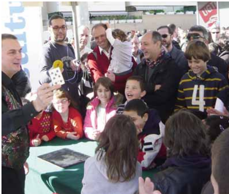
Més de mil persones van participar a la I Trobada de mags de Catalunya que es va celebrar a la plaça del mag Li-Chang.

La màgia ha arribat també a biblioteques, centres cívics, carrers i ha permès, un any més, que els joves presentin els nous talents en el concurs infantil i juvenil de màgia.