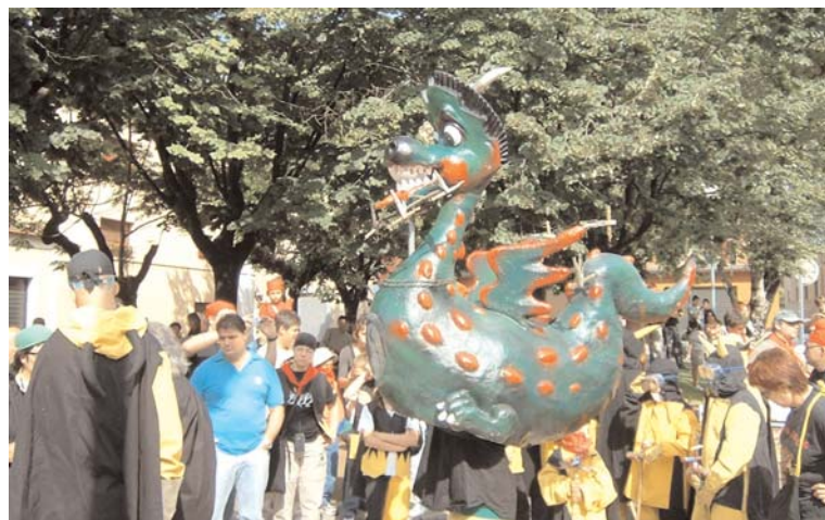
Uns cinc mil diables i dimonis d'arreu dels Països Catalans varen participar en la I Fira del món del Foc.