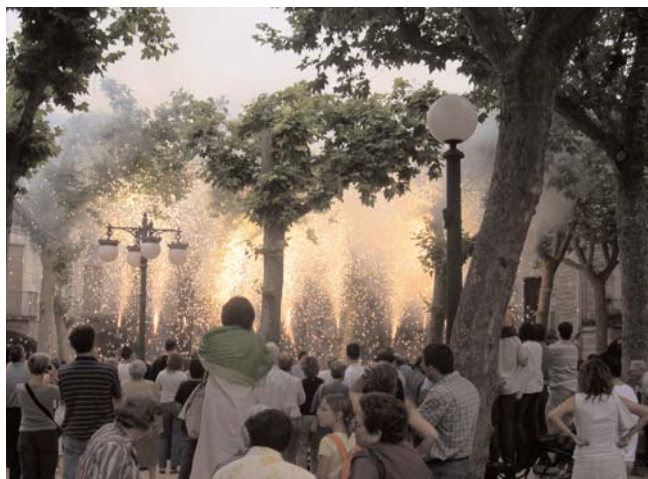
El Ball de Sant Miquel a la plaça Major de Banyoles.