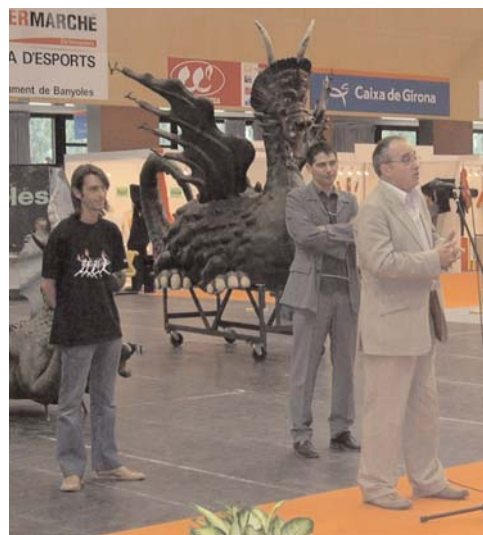
El Conseller en cap, Josep Bargalló, Josep Enric Martí Abrós, president de la Federació de Diables i Dimonis de Catalunya, i Pere Bosch, alcalde de Banyoles, durant l'acte d'inauguració de la I Fira del món del Foc.

D'altra banda, el director general de Cultura Tradicional i Popular de la Generalitat, Ferran Bello, va anunciar que s'està elaborant una nova llei en la qual estaran reflectides totes les festes populars i elements festius del país. Aquesta llei identificarà les festes que tinguin un interès cultural, les que representin un interès nacional i les que siguin d'interès patrimonial.