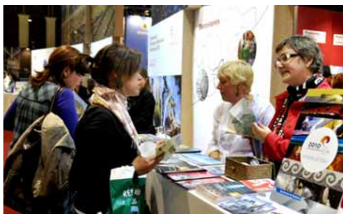
Estand de la Capital de la Cultura Catalana Badalona 2010.

Podeu consultar la programació de la Capital de la Cultura Catalana Badalona 2010 a: www.badalona2010.cat