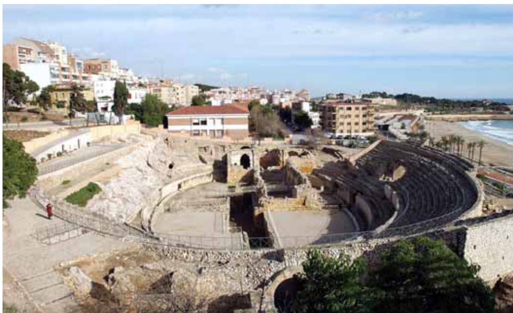
Tarragona. Amfiteatre romà.

La ciutat de Tarragona, de 140.323 habitants i una superfície de 62,64 Km 2 , pretén aprofitar la Capital de la Cultura Catalana 2012 per a potenciar el coneixement i la difusió de les moltes activitats culturals que la ciutat ja desenvolupa, tant en l'àmbit públic com en el privat.