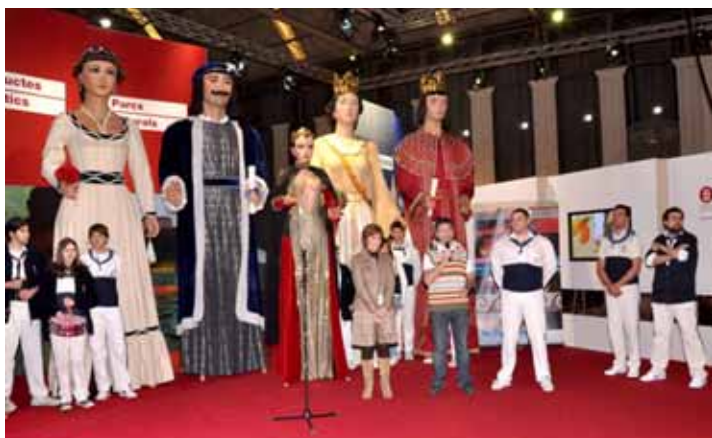
La presentació de Badalona 2010 va ser amenitzada amb l'actuació de la colla dels geganters de Badalona.

El SITC, que es va celebrar a les instal·lacions de Fira de Barcelona, és considerat l'esdeveniment firal turístic més important de Catalunya.