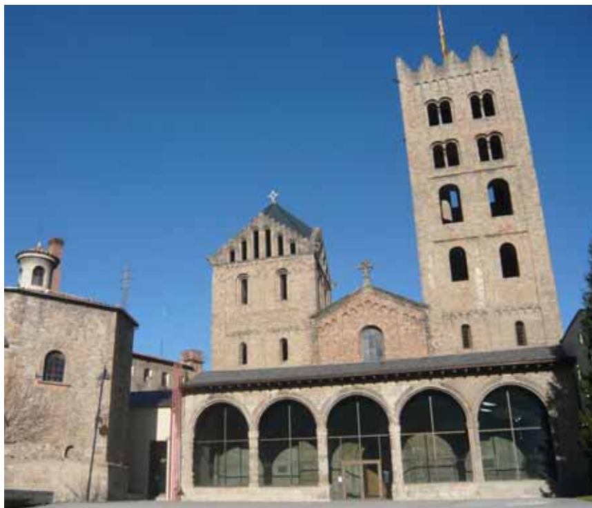
Monestir de Santa Maria de Ripoll.