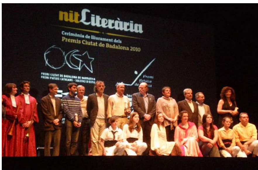
Foto de família de la Nit Literària de Badalona.