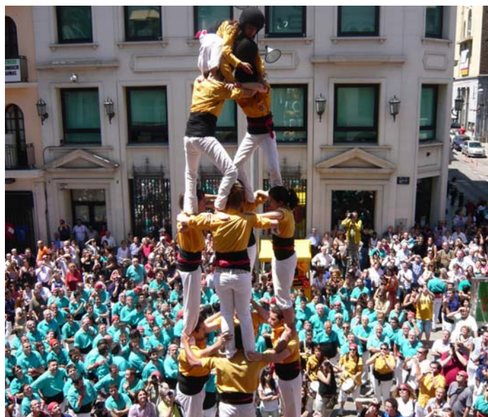
Castellers de Badalona.