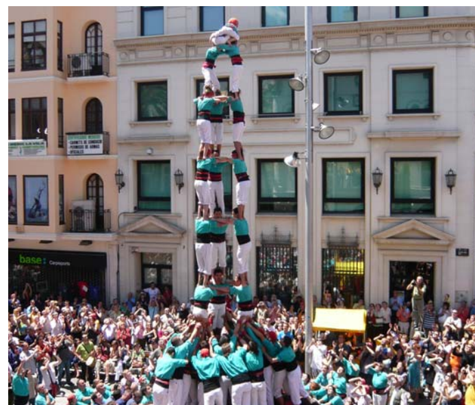
Castellers de Vilafranca.