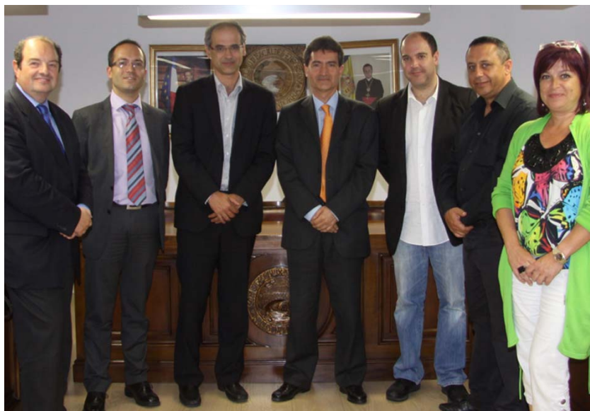
Reunió del Comitè Organitzador de la Capital de la Cultura Catalana 2011 a la seu del Comú d'Escaldes-Engordany.