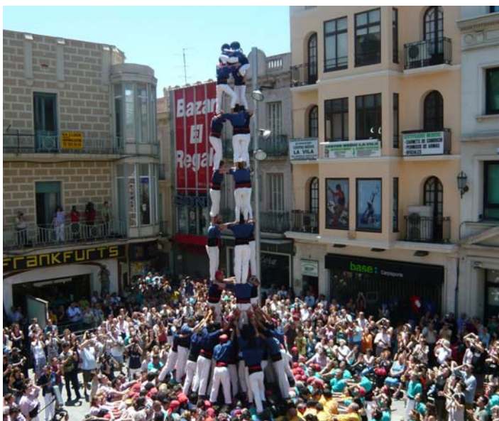
Capgrossos de Mataró.

Els Castellers de Vilafranca van aixecar un 4 de 8 amb agulla, un 3 de 9 amb folre, un 4 de 9 amb folre i un pilar de sis; Els Minyons de Terrassa van aixecar un 2 de 8 amb folre, un 3 de 9 amb folre, un 5 de 8 i un vano de 5; els Capgrossos de Mataró van aixecar un 2 de 8 amb folre, un 3 de 9 amb folre, un 4 de 8 i un pilar de 6; finalment, els Castellers de Badalona van alçar un 5 de 6, un 4 de 7, un 3 de 7 i un pilar de 5. En total, doncs, i per primera vegada a Badalona, es van aixecar quatre castells de nou pisos.