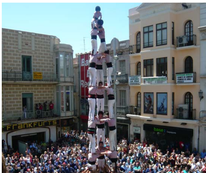
Minyons de Terrassa.