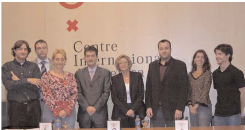
Regidors i tècnics dels diversos ajuntaments que van presentar candidatura, en el Centre Internacional de Premsa de Barcelona el 20 d'octubre, dia de la designació de la Capital de la Cultura Catalana 2006.

L'Organització promotora de la Capital de la Cultura Catalana ha valorat com a molt important el fet que un total de 645 entitats dels diferents indrets del país hagin donat suport a les set candidatures presentades.