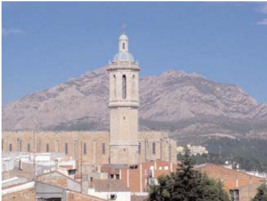
La restauració exterior del campanar d'Esparreguera s'ha acabat a temps per a la celebració de la Capital de la Cultura Catalana 2005.