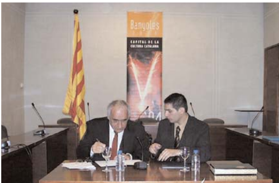
Els alcaldes de les poblacions de Ceret i Banyoles durant la signatura de l'agermanament entre ambdós municipis el dia 25 d'octubre a la sala de plens de l'Ajuntament de la Capital de la Cultura Catalana 2004.

Un dels principals elements distintius del col·lectiu El Tint fou la seva preocupació per superar els cercles vinculats a l'art estricte i a l'alta cultura. En aquest sentit, el seu propòsit s'allunyava intencionadament de la producció de nous objectes artístics i el seu interès es va orientar envers l'anàlisi crítica de realitats ja existents, sobretot vinculades als gustos estètics i als hàbits culturals dels grups socials, amb la finalitat de desemmascarar els seus mecanismes de funcionament i significació. La crítica cap al mercat de l'art i a la mitificació de l'artista, la influència de determinats plantejaments ideològics provinents bàsicament del moviment conceptual, i una certa orientació científica van determinar que el Tint-2 no fes cap activitat pròpia a l'entorn de les arts plàstiques tradicionals. Contràriament, la seva opció fou l'adopció d'una perspectiva més àmplia centrada en la comunicació i la cultura visual, que va prendre el tema del kitsch, en algunes de les seves diverses expressions, com a eix vertebrador del conjunt de les propostes.