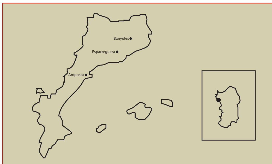
Distribució geogràfica de les tres primeres capitals de la cultura catalana: Banyoles 2004, Esparreguera 2005 i Amposta 2006.