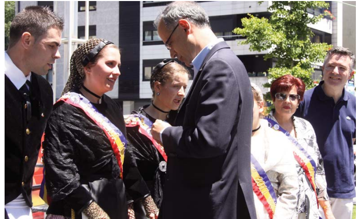
Antoni Martí, cap del Govern d'Andorra, durant la celebració de la creació de la parròquia d'Escaldes-Engordany.