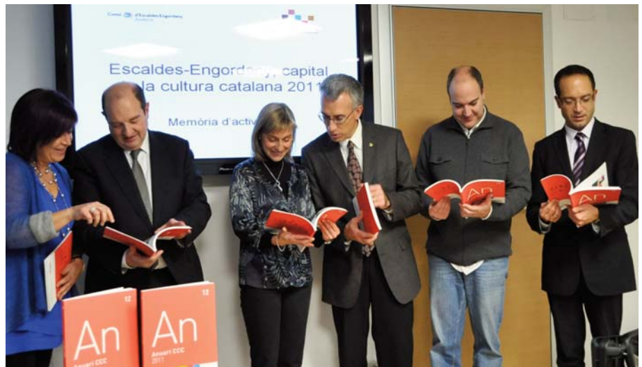
Darrera reunió del comitè de treball d'Escaldes-Engordany-2011.

Finalment, pel que fa al recursos emprats, Escaldes-Engordany ha acabat amb un pressupost equilibrat, sense dèficit. La xifra d'ingressos i de despeses ha estat de 325.000 euros.