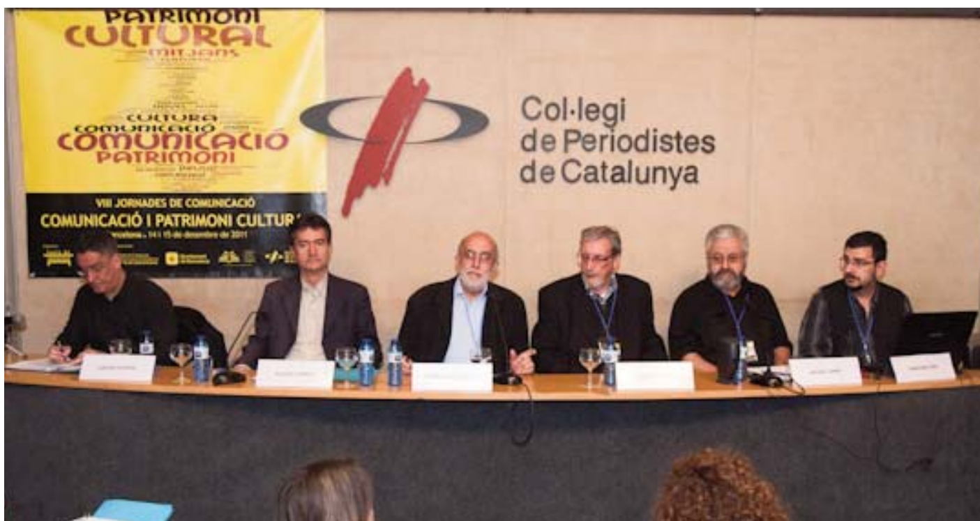
Taula rodona de les jornades sobre "Comunicació i Patrimoni Cultural".