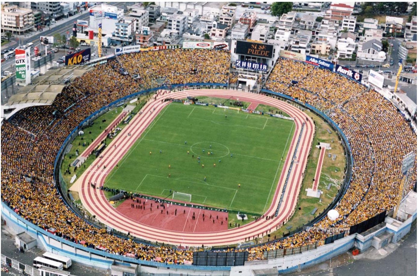
Estadi Olímpic Atahualpa de Quito (Equador) on juguen, entre d'altres, el Deportivo Quito, el Nacional i la selecció nacional de l'Equador.

La penetració de l'esport com a instrument cohesionador de la societat s'inicia a l'època moderna amb la reinstauració dels Jocs Olímpics, el 1896, i es consolida amb la constitució de les federacions internacionals esportives de tots els esports que actualment existeixen en el món.