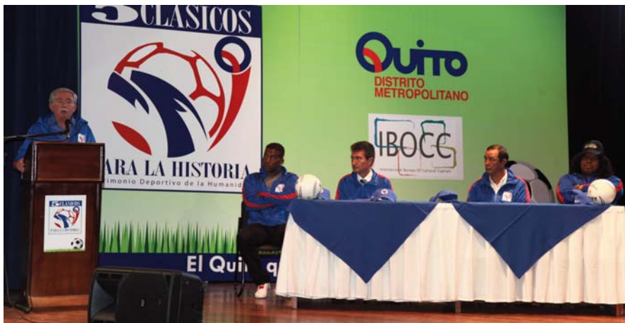
Presentació de la campanya "5 partits jugats a Quito patrimoni de la humanitat".

Trobareu més informació al website de la Capital Americana de la Cultura: www.cac-acc.org