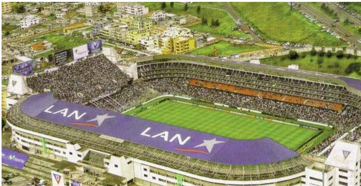
Estadi de la Liga Deportiva Universitaria.