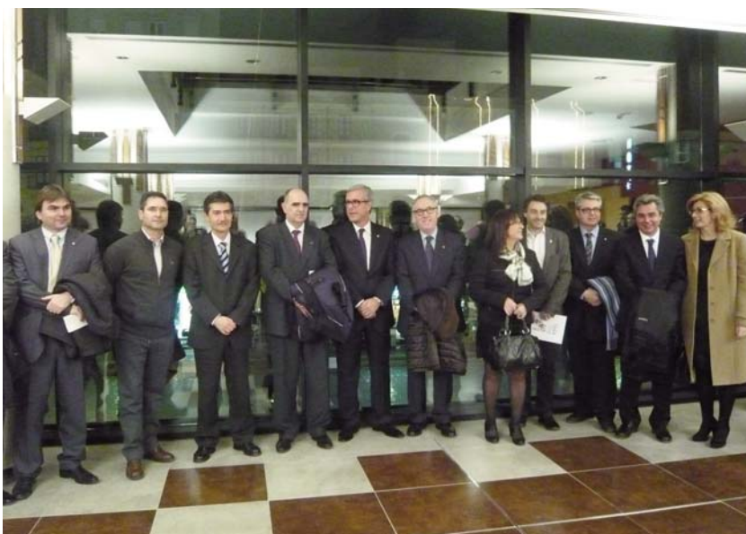
Autoritats assistents al relleu de la Capital de la Cultura Catalana i a la inauguració del nou Teatre Tarragona

2004: Banyoles 2005: Esparreguera 2006: Amposta 2007: Lleida 2008: Perpinyà 2009: Figueres 2010: Badalona 2011: Escaldes-Engordany 2012: Tarragona 2013: Ripoll 2014: Barcelona 2015: Vilafranca del Penedès 2016: Vic