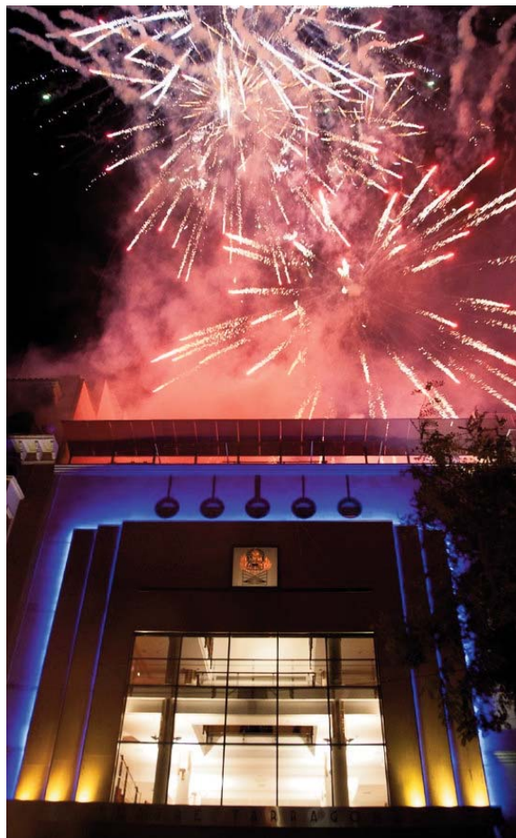
Façana del Teatre Tarragona durant la inauguració d'aquest nou equipament cultural